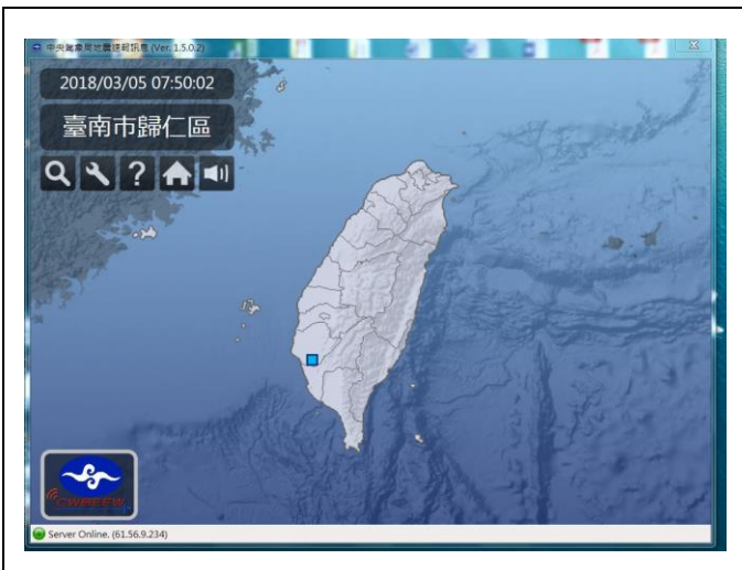
中央氣象局強震即時警報軟體