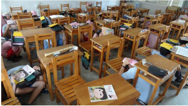
師生趴下、掩護、穩住