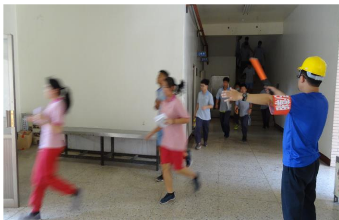
火災引導疏散避難