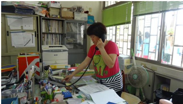
通報並啟動學校緊急應變組織